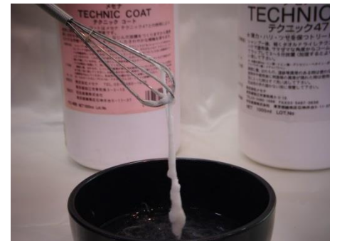
が結合 タンパク質形成

クリニックシステムのメカニズムは上記写真の様に髪の毛のケラチン蛋白を形成しているアミノ酸を+と-に分けて低分子の状態にした溶液を毛髪内で結合させます。そうすることで髪の毛の芯をしっかりと形成しハリ、コシを与えて毛髪強度を強くします。そこに熱を加えてタンパク質に形状記憶をさせるシステムです。