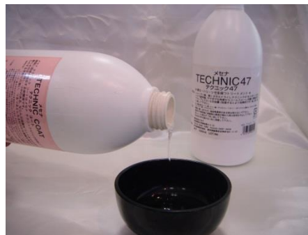
と テクニックコート